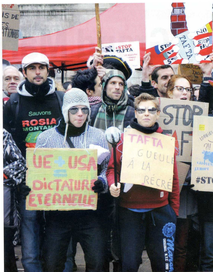
mobilisation citoyenne Stop Tafta - Paris, 24.11.13

La libéralisation des services : TAFTA vise la libéralisation et la dérégulation de tous les services qui ne seraient pas explicitement « protégés » dans une liste soumise par l'UE. Les services financiers sont concernés, au risque de provoquer une nouvelle crise financière internationale ! De plus, l'harmonisation des normes européennes et américaines pourraient encourager au sein de l'UE la marchandisation dans certains secteurs tels que la santé.